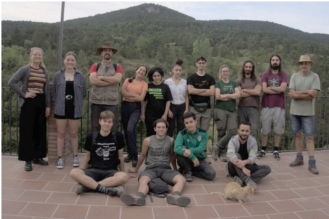
Equip de recerca que ha participat durant aquest estiu als jaciments de la Cova de les Borres i la Cova Serena.