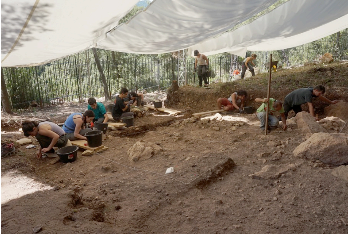
Imatge dels treballs d'excavació al jaciment de la Cova de les Borres.

Aquesta ampliació de la superfície d'excavació ha permès documentar amb més resolució les fases més recents d'ocupació prehistòrica del jaciment (Nivells 1.0 i 1.1). A més de la recuperació de restes materials, també s'han excavat estructures arqueològiques (cercles de pedres, llars, elements de sustentació,...). L'aprofundiment en el coneixement d'aquests nivells superiors de la seqüència és molt important per a l'estudi de l'evolució tecnològica i cultural de l'Epipaleolític, ja que el Nivell 1.2 constitueix una de les evidències més antigues (13.000 anys abans del present) de projectils geomètrics a l'Epipaleolític mediterrani.