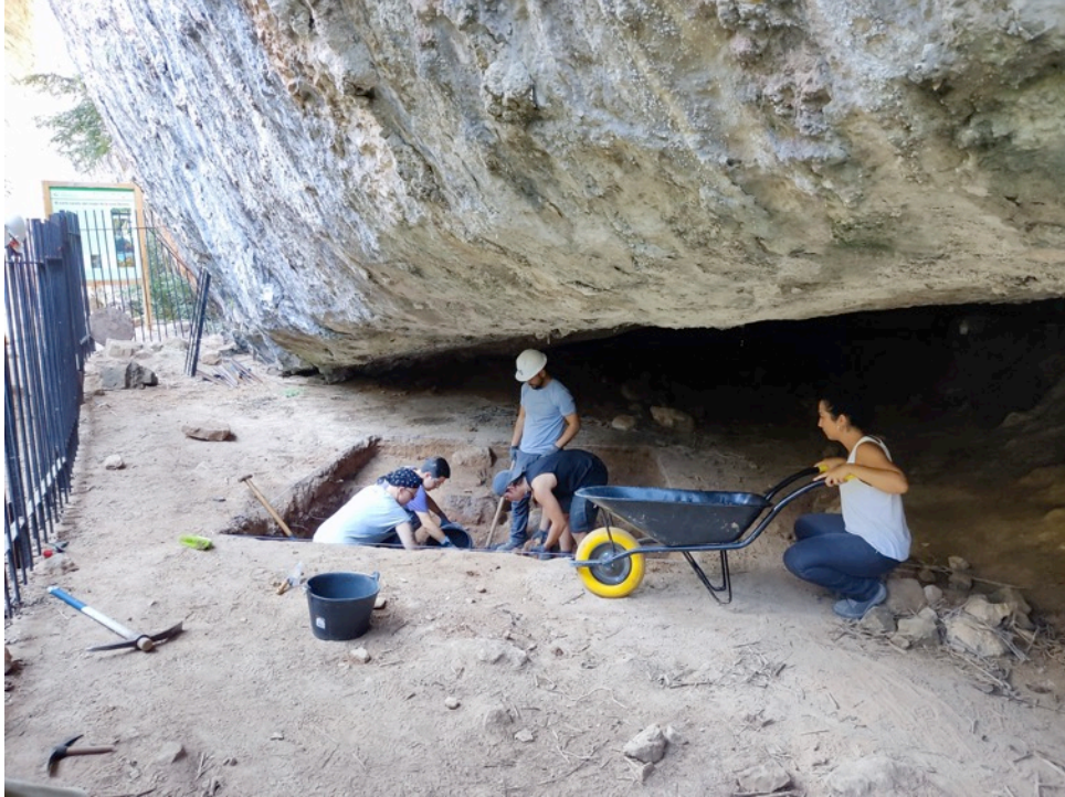
Imatge dels treballs d'excavació al jaciment de la Cova Serena.

A la Cova de les Borres, s'han continuat amb els treballs d'excavació sistemàtica que es fan de manera anual des del 2012. Un dels objectius principals de la intervenció ha estat l'excavació i documentació del tram superior de la seqüència al sector d'ampliació de l'àrea d'excavació iniciat durant la campanya anterior.