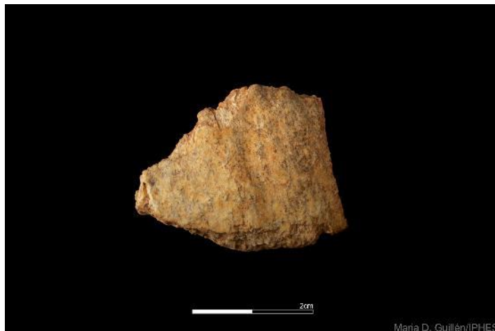
Foto 15. Fragmento de cráneo de neandertal recuperado en el yacimiento de Cueva Fantasma.

Tras ocho años del hallazgo de un parietal humano neandertales en otro sector de la cueva (Sala Fantasma), en esta campaña se ha recuperado un pequeño fragmento circular de un hueso del cráneo de un neandertal.