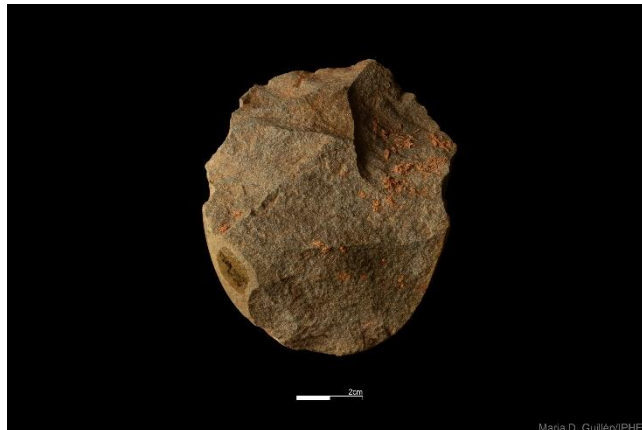
Foto 10. Núcleo de arenisca procedente del yacimiento de Galería.