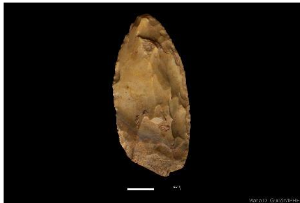
Foto 14. Punta de sílex cretácico recuperado en el yacimiento de Cueva Fantasma.

Al nivel CF25 se ha recuperado una pequeña colección de instrumentos líticos, tales como ascles de sílex, arenisca y cuarcita, identificado el desarrollo del método de talla levallois . Este nivel destaca por la acumulación de huesos con mayor índice de fracturación principalmente realizada por neandertales y hienas. En estos huesos aparecen marcas de actividad humana (como la fractura para la extracción de médula ósea). Hay otros huesos que han sido procesados y regurgitados por las hienas.