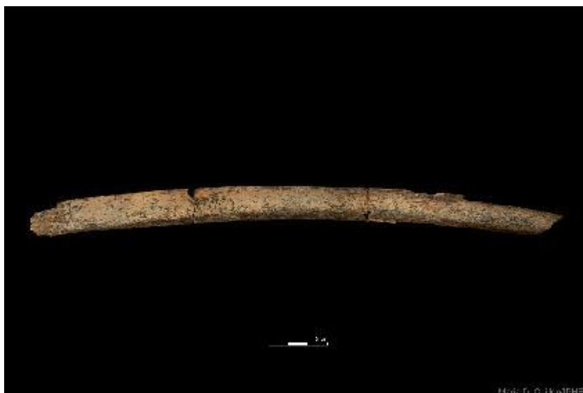
Foto 7. Costilla de herbívoro de talla grande con marcas de corte en su superficie recuperada en el yacimiento de la Sima del Elefante.

Los resultados de la campaña de excavación en el yacimiento de la Sima del Elefante han sido muy positivos. Los objetivos que se plantearon en el inicio de la excavación han sido alcanzados con éxito. Por un lado, se ha acabado de excavar la capa arcillosa del nivel TE7 en la que apareció el resto humano llamado Pink en 2022, así como restos de industria lítica durante la campaña de 2023. En esta campaña, en esta capa, se ha recuperado una costilla de un herbívoro de talla grande que presenta marcas de corte relacionadas con la acción de descarnar al animal por parte de los homínidos que habitaron este entorno hace entre 1,2-1,4 millones de años.