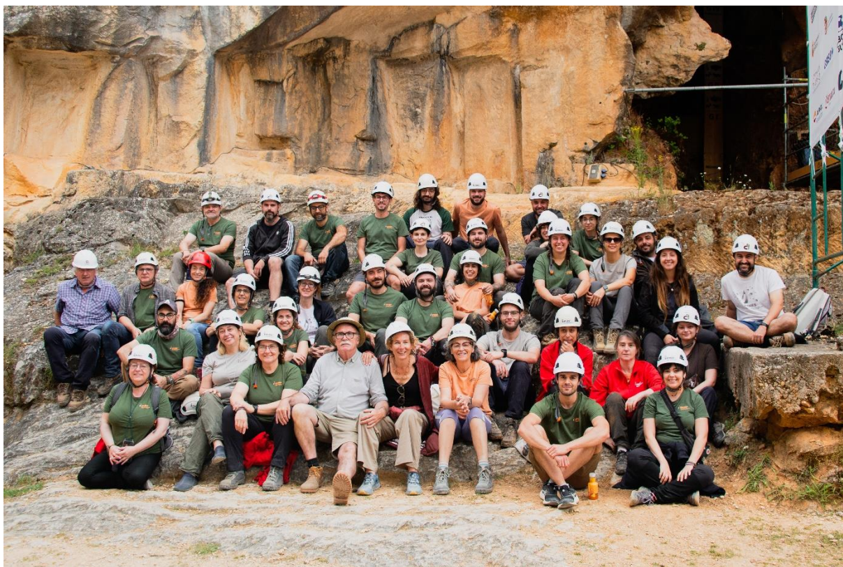
Foto 1. Personal investigador y técnico del IPHES-CERCA y estudiantes del máster de la URV estos días de campaña de excavaciones en la sierra de Atapuerca.

yacimientos clave y en el lavado de los sedimentos de este complejo arqueopaleontológico único.