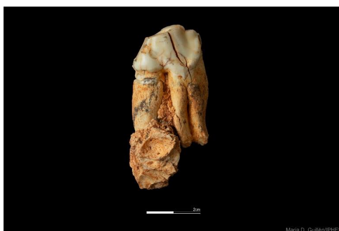
Foto 17. Premolar de hiena gigante recuperada en el yacimiento de Cueva Fantasma.