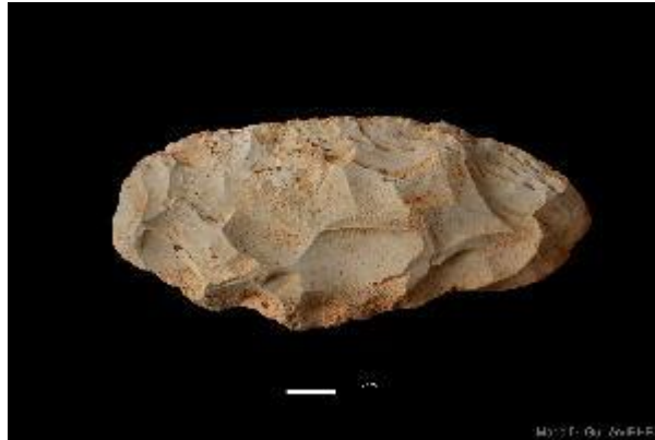
Foto 11. Raedera de sílex neógeno procedente del yacimiento de Galería.