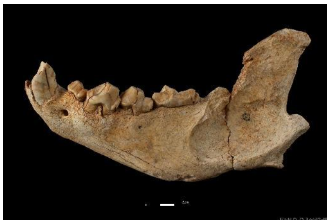
Foto 16. Mandíbula de hiena manchada recuperada en el yacimiento de Cueva Fantasma.