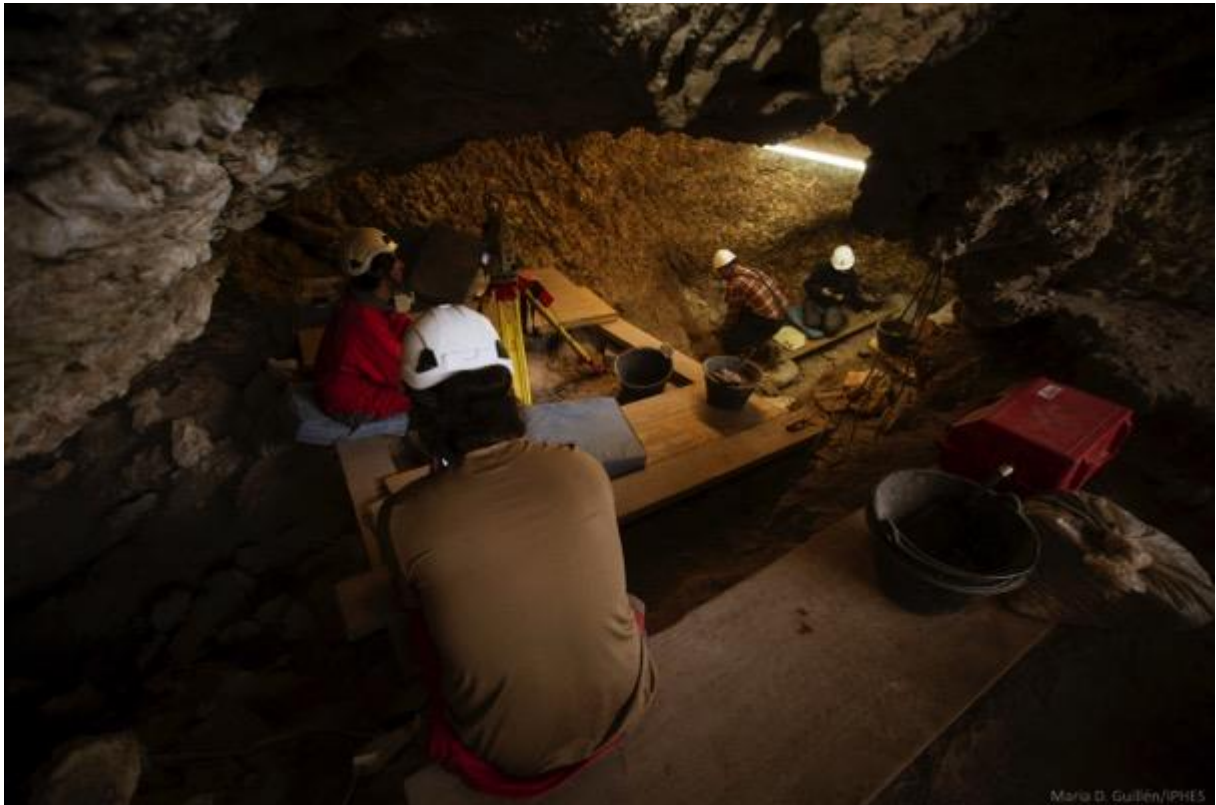
Foto. 18. Vista general de la excavación en el yacimiento de cueva de El Mirador.

Destaca el descubrimiento de arte rupestre, tanto en las paredes de la cueva, donde se conservan restos de pinturas, como entre los sedimentos del antiguo neolítico. Se ha encontrado un bloque de 40x30x20 centímetros recubierto de pigmento rojo, junto al que había, entre otros elementos, un núcleo de sílex con una digitación roja, y la base de un recipiente decorado con un magnífico soliforme (representación en forma de sol), también con restos de pigmento rojo.