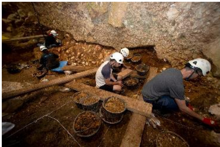
Foto 6. Trabajos de excavación en el yacimiento de la Sima del Elefante.

Los resultados de la campaña de excavación en el yacimiento de la Sima del Elefante han sido muy positivos. Los objetivos que se plantearon en el inicio de la excavación han sido alcanzados con éxito. Por un lado, se ha acabado de excavar la capa arcillosa del nivel TE7 en la que apareció el resto humano llamado Pink en 2022, así como restos de industria lítica durante la campaña de 2023. En esta campaña, en esta capa, se ha recuperado una costilla de un herbívoro de talla grande que presenta marcas de corte relacionadas con la acción de descarnar al animal por parte de los homínidos que habitaron este entorno hace entre 1,2-1,4 millones de años.