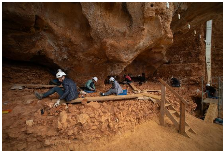
Foto 8. Trabajos de excavación en el yacimiento de Galería.

Los trabajos de excavación en el yacimiento de Galería, se han centrado en la Subunidad GI1b, con una antigüedad de aproximadamente 300.000 años. A partir de ese momento la dinámica de la excavación tomará una importancia primordial para las próximas campañas, ya que se intervendrá en lo que ya se conoce como los niveles más ricos de este yacimiento.