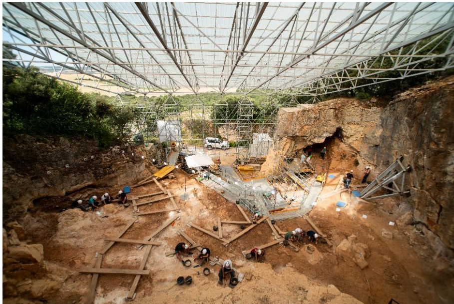
Foto 12. Trabajos de excavación en el yacimiento de Cueva Fantasma.

Los trabajos de excavación en el yacimiento de Cueva Fantasma se han desarrollado en dos sectores diferenciados del yacimiento: el sector de entrada de Cueva Fantasma (CF) donde se documentan los niveles de ocupación de los neandertales, y la parte interna o Sala Fantasma (SF), donde se localizan los niveles de actividad de las hienas.