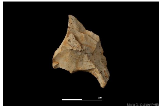
Foto 4 y foto 5. Denticulados de sílex neógeno recuperados en el nivel TD6 de la Gran Dolina.

Los resultados de esta campaña, por tanto, confirman la buena conservación de la unidad TD6 de Gran Dolina, evidenciando el riquísimo contenido fosilífero, y auguran unas campañas excelentes para los próximos años, con las que, sin duda, el EIA volverá a revolucionar el panorama científico de Europa.