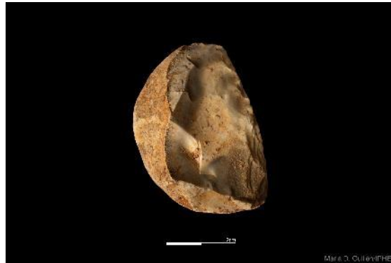
Foto 13. Raedera de sílex cretácico recuperada en el yacimiento de Cueva Fantasma.

Cueva Fantasma se ha continuado excavando en la Covacha norte, nivel CF26A. En este nivel, con una antigüedad comprendida entre 70.000 y 100.000 años, se ha recuperado una importante colección de industria lítica. Ésta sería el área de mayor actividad de los neandertales en la cueva. La industria lítica y los huesos recuperados demuestran que los neandertales frecuentaban esta cavidad de forma esporádica.