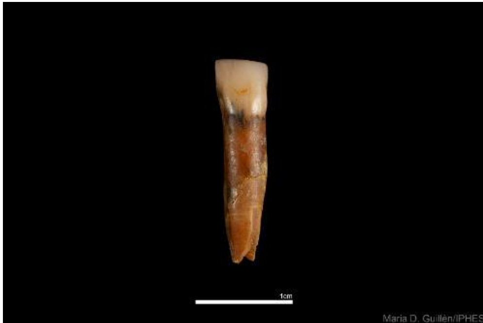
Foto 2. Incisivo de Homo antecessor recuperado durante la campaña de 2024 en la unidad TD6 de la Gran Dolina.