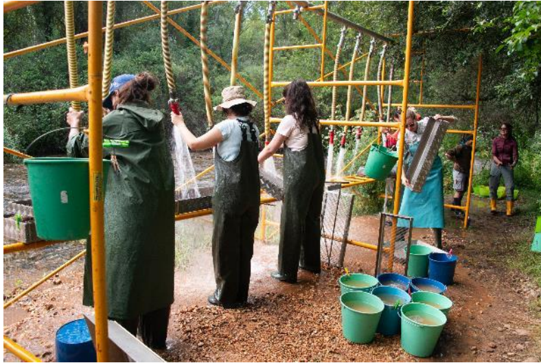
Foto 19. Trabajos de lavado de sedimento en el río Arlanzón por su paso al pueblo de Ibeas de Juarros.

Elefante, Galería, Gran Dolina, Penal, Cueva Fantasma y Galería de las Estatuas Exterior. Durante esta campaña también se procesaron en el área de lavado del río Arlanzón muestras procedentes de los yacimientos de la cueva de El Mirador, Galería de las Estatuas Interior, Cueva Mayor y Portalón.