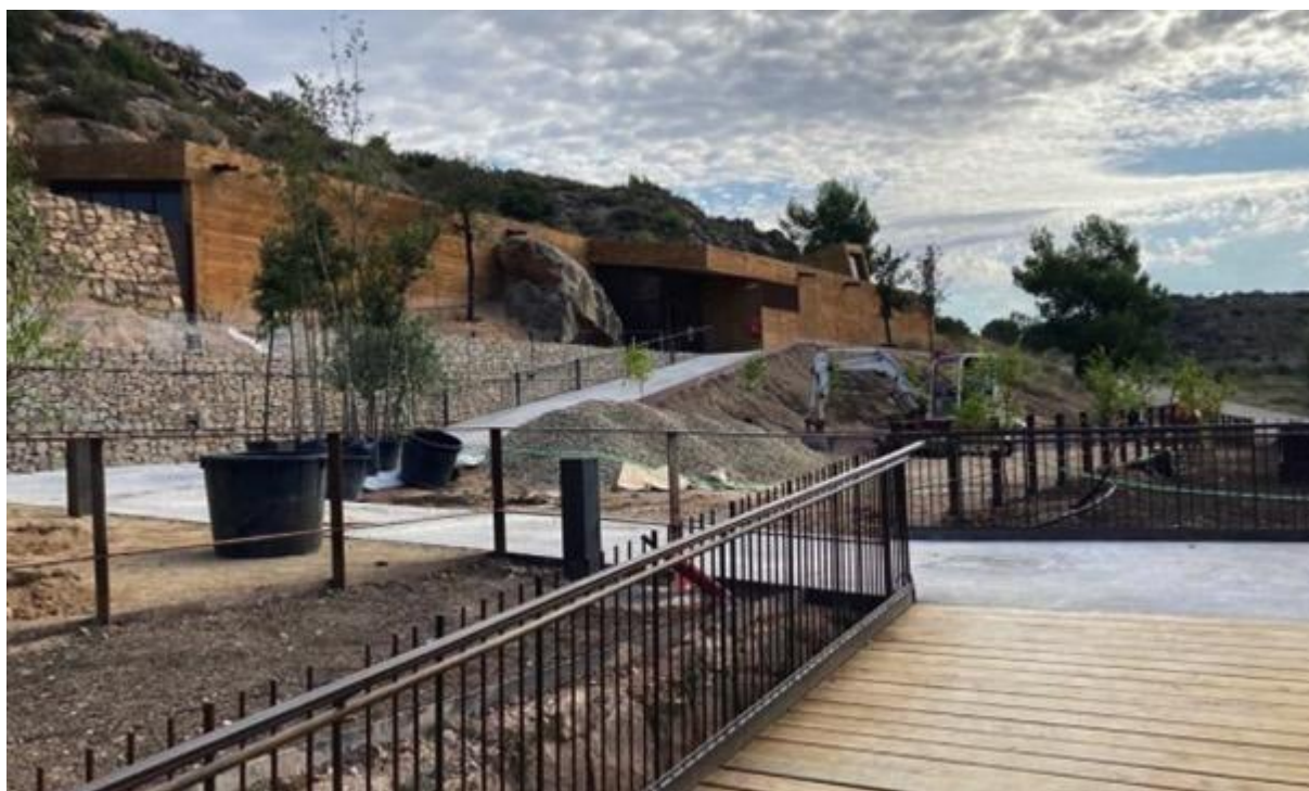
Imatge general del centre d'interpretació de la Roca dels Moros del Cogul amb els nous accessos de l'equipament inaugurats el mes de març d'aquest any.

Per altra banda, s'incidirà també en els equipaments museogràfics relacionats amb el jaciment, els quals permeten al visitant poder conèixer de primera mà aquest patrimoni tant excepcional.