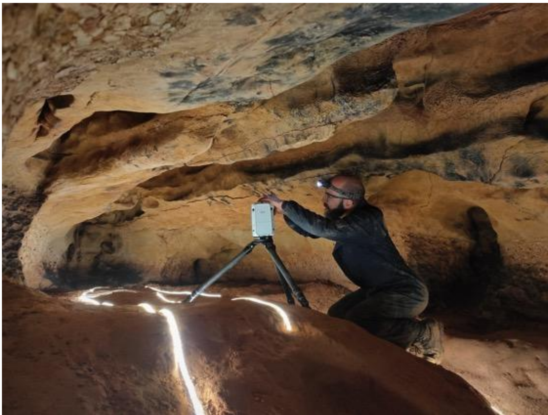
Treballs d'escaneig 3D dels gravats a la Cova de la Font Major - Servei d'Arqueologia i Paleontologia. Direcció General del Patrimoni Cultural. Departament de Cultura

Un cop finalitzat el procés de cerca i catalogació, es fa una posada al dia de l'estat dels treballs de documentació dels gravats paleolítics de la cova de la Font Major. La documentació ha inclòs l'escaneig 3D d'alta resolució i l'obtenció de textures mitjançant fotogrametria, a partir dels quals s'han generat models tridimensionals d'alta qualitat. El fet de poder treballar sobre els gravats a partir dels seus models 3D incrementa la qualitat i objectivitat de la recerca, i permet realitzar bona part de la feina al laboratori, reduint el temps de treball a la cova i, per tant, el perill de causar danys durant l'estudi, molt present en el cas de les Gatones de cal Palletes, a causa del reduït de l'espai i de la fragilitat de la superfície on es troben les representacions.