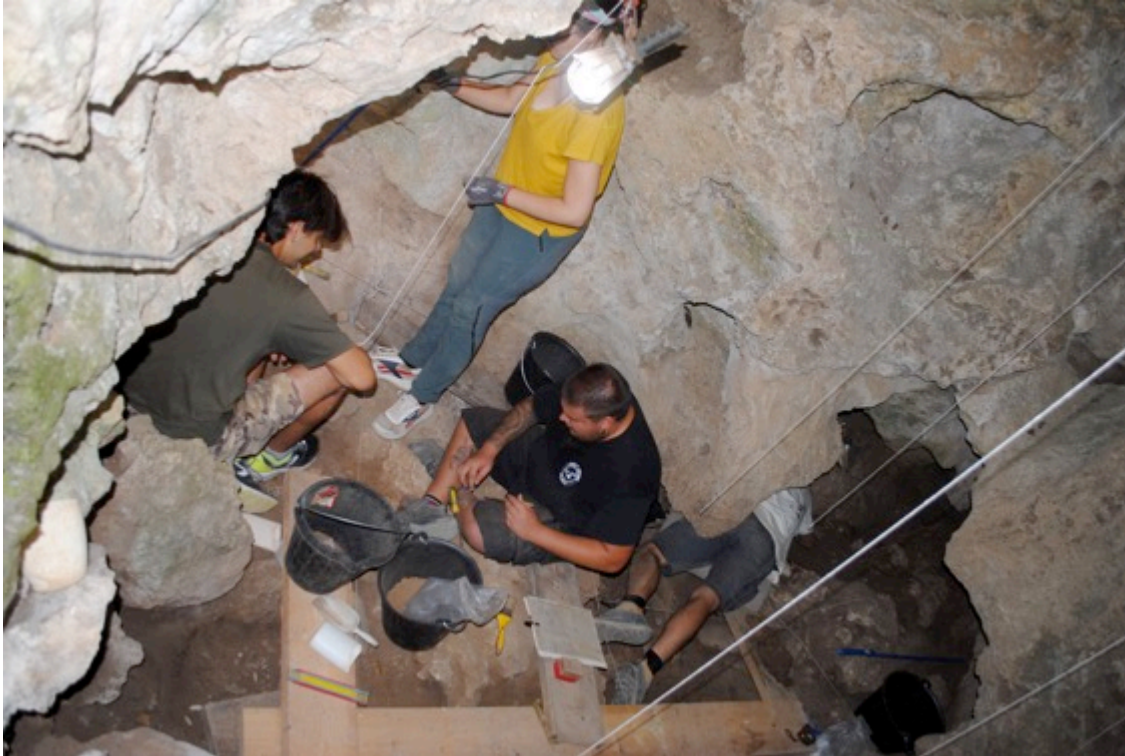
Trabajos de excavación arqueológica en la cova d'en Pau, de Serinyà (Pla de l'Estany) durante este mes de julio.

prehistoria reciente fueron excavados casi por completo por J.M. Corominas y por el Dr. Josep Tarrús, quien dirigió las excavaciones en el yacimiento a principios de la década de los 80.