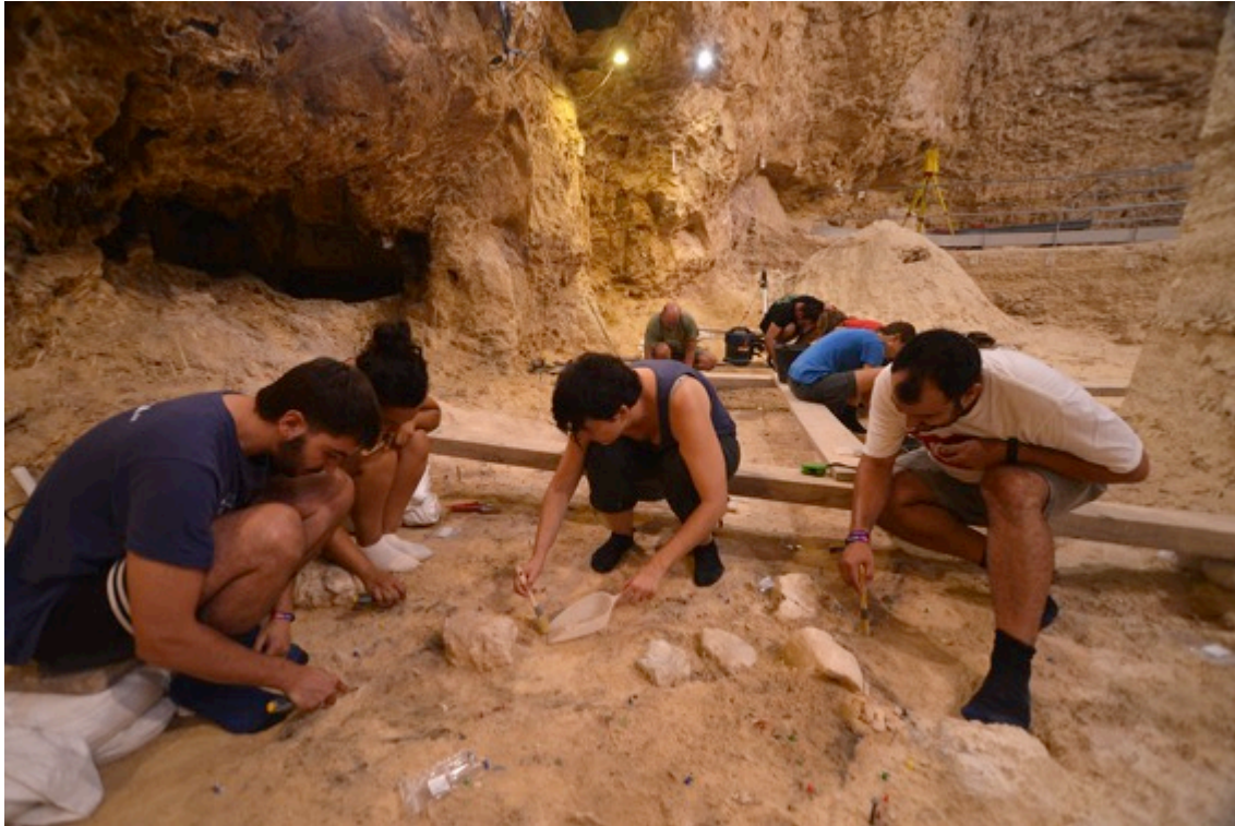
Trabajos de excavación en el yacimiento del Abric Romaní este pasado mes de agosto.