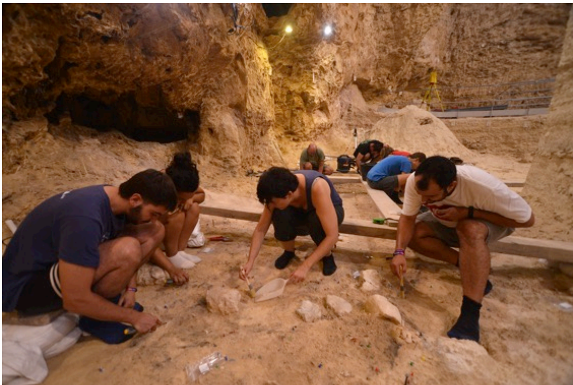
Treballs d'excavació al jaciment de l'Abric Romaní aquest passat mes d'agost.