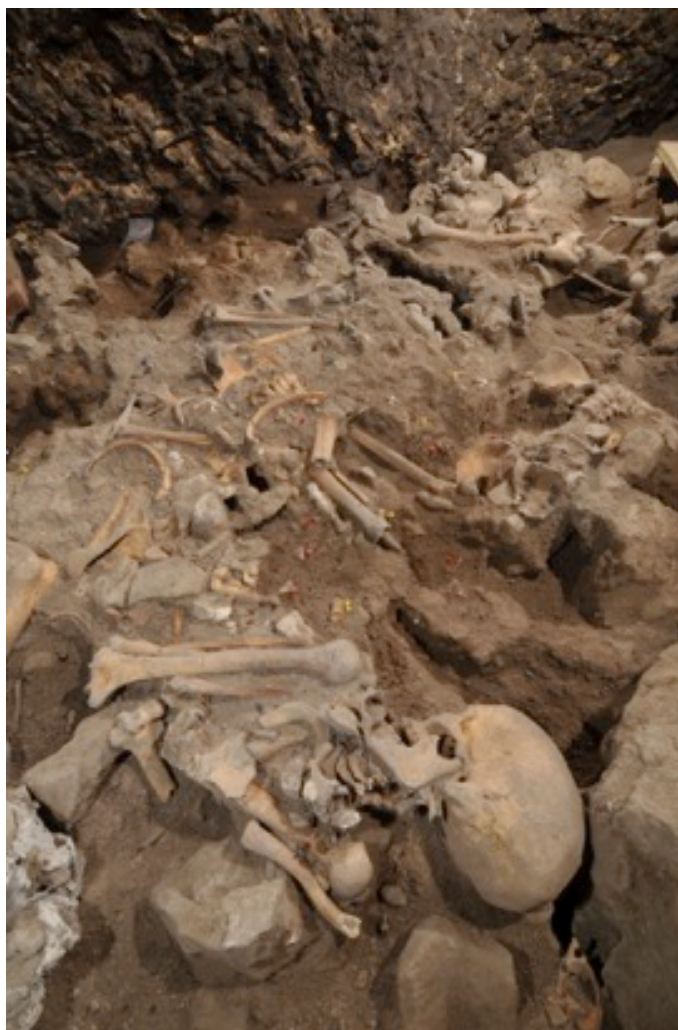
Imatge de les restes humanes de la cova de El Mirador.

Posteriorment, durant el Bronze inicial i mig, fa uns 4.400 i 3.700 anys, les tombes passen a ser individuals i es documenta la pràctica del canibalisme, probablement de caràcter ritual. Per raons que encara no es coneixen, la cova va deixar de ser utilitzada per a finalitats sepulcrales, recuperant-se cap al 3.600 anys el seu ús d'hàbitat i d'estable. I va continuar essent així fins a aproximadament 3.200 anys, moment en el qual, la successió estratigràfica apareix tallada.