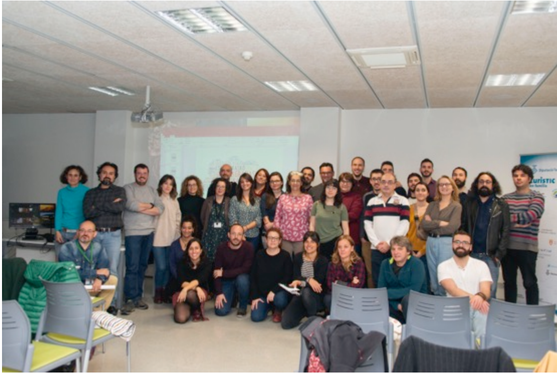
Fotografia dels participants a la reunió científica duta a terme l'any 2019 a les instal·lacions de l'IPHES-CERCA.

L'obra que s'acaba de publicar és el resultat de la reunió científica que es va dur a terme l'any 2019 a les instal·lacions de l'IPHES-CERCA, justament l'any en què es celebraven els 20 anys d'excavació en el jaciment. En aquella reunió, organitzada pels propis editors del monogràfic, hi van participar pràcticament totes les investigadores i investigadors involucrats en la recerca al jaciment, els quals van tenir l'oportunitat de presentar presencialment els resultats de la seva recerca multidisciplinària aplicada al registre arqueològic a la cova de El Mirador.