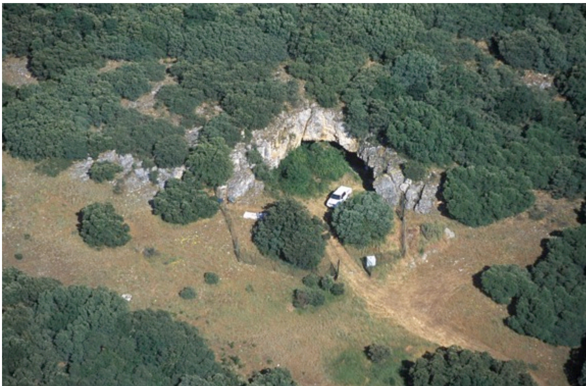
Imatge de l'exterior de la cova de El Mirador a la Sierra de Atapuerca.

Les primeres ocupacions humanes documentades en el jaciment es remunten als 13.500 anys, quan grups humans de caça i recol·lecció magdalenians van utilitzar la cova per tal d'establir-hi el seu campament. Després d'aquesta fase d'ocupació, la cova va ser abandonada durant més de 5.000 anys, convertint-se en lloc de refugi per a llops, els quals van aprofitar les esquerdes generades per la caiguda de grans blocs a l'entrada per tal d'establir-hi els seus cubils.