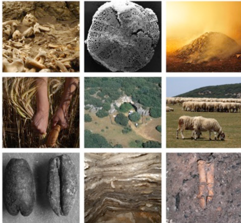
Composició de diferents imatges relacionades amb la cova de El Mirador d'Atapuerca.