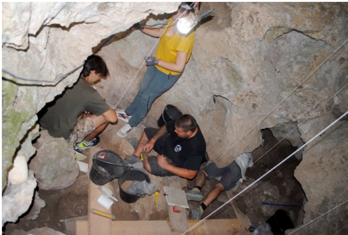
Treballs d'excavació arqueològica a la cova d'en Pau, de Serinyà (Pla de l'Estany) durant aquest mes de juliol.